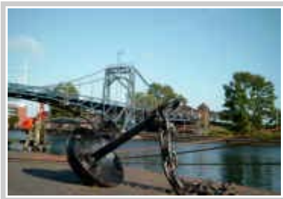
„Kaiser Wilhelmbrücke“ Wilhelmshaven