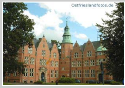
„Ostfriesische Landschaft“ Aurich